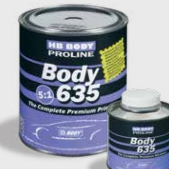
635 5:1 HS Filling Primer