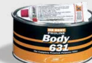
631 Light Multi Filler vynikajúca príľnavosť na všetky typy zinkových povrchov