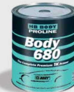
680 1K Filling Primer