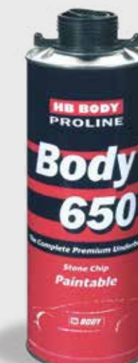
650 Stone Chip