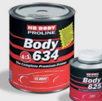
634 4:1 HS Filling Primer