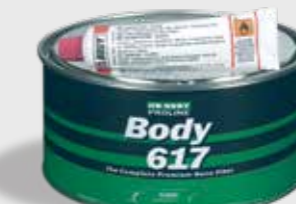
617 Nano Fiber