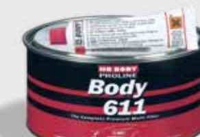
611 Multi Filler