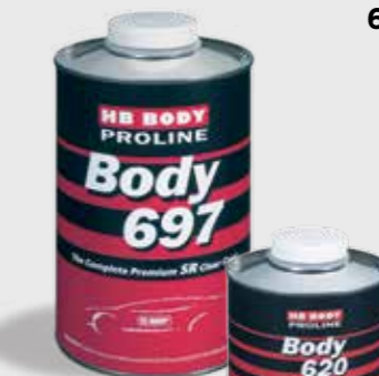
697 2:1 HS Clear Coat SR