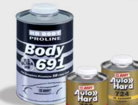
691 2:1 UHS Clear Coat SR