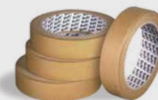
Maskovacia páska 60°C Hnedá