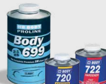
699 2:1 HS Clear Coat SR