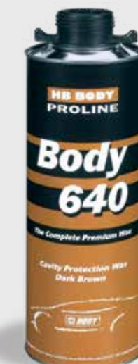
640 Cavity Wax